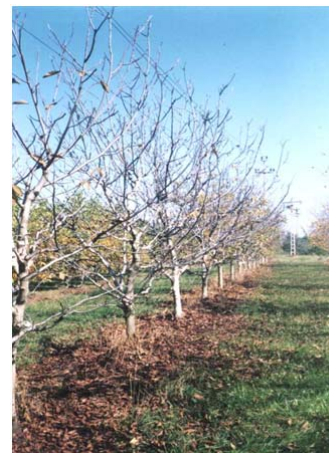
Foto 6. Defolierea prematură a nucilor datorată atacului sever de antracnoză (original)