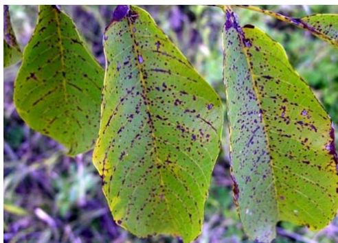
Foto 4. Atac de bacterioză pe frunze

B.2. Bacterioza nucului Xanthomonas campestris p.v. juglandis , (foto 4)