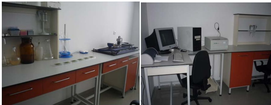
Foto 1- Aspecte din laboratorul pentru testări ELISA